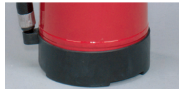
Abb. 1 Wandhalter serienmäßig Abb. 2 Schlauchhalterung im Fußring integriert Abb. 3 Stabiler Fußring